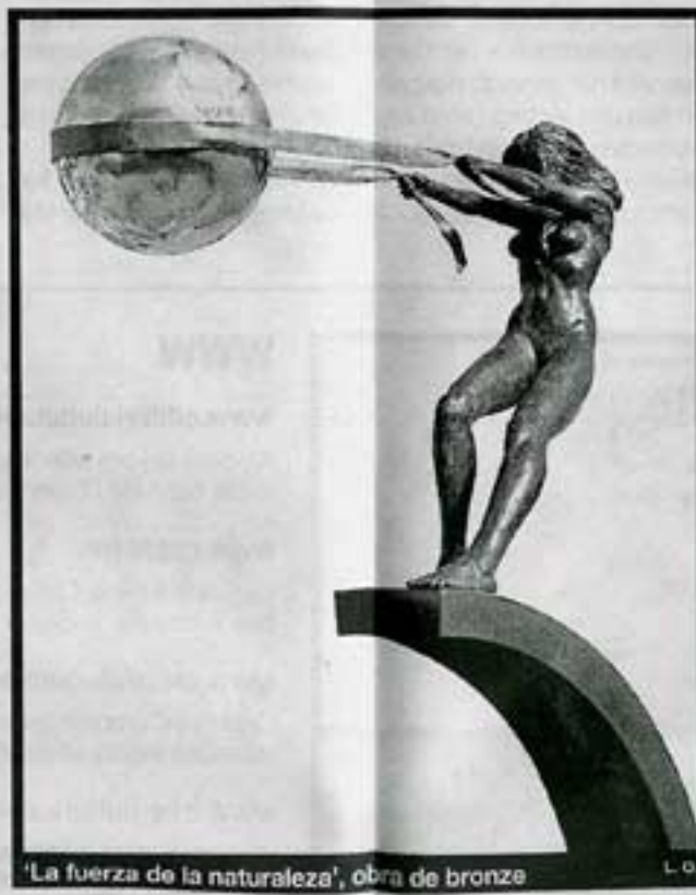
'La fuerza de la naturaleza', obra de bronze

El temps, les emocions, la llibertat o les tensions del dia a dia són altres dels temes que proposa l'autor en la seva obra. I és que, de fet, aquesta creació tindrà aviat una seu pròpia a les comarques de Ponent perquè l'autor, juntament amb Ramiro Rafart, impulsa una galeria per exposar una selecció de la seva obra a Almenar. Lorenzo Quinn vol que la seva creació estigui a l'abast de tots els públics i per això portarà peces de diversos formats, mides i materials en aquesta galeria. Aportar per Almenar, segons diu el mateix autor, és portar la seva obra a un lloc que és porta d'entrada cap a la Val d'Aran, una terra que Quinn coneix bé i en la que ha exposat diverses vegades.