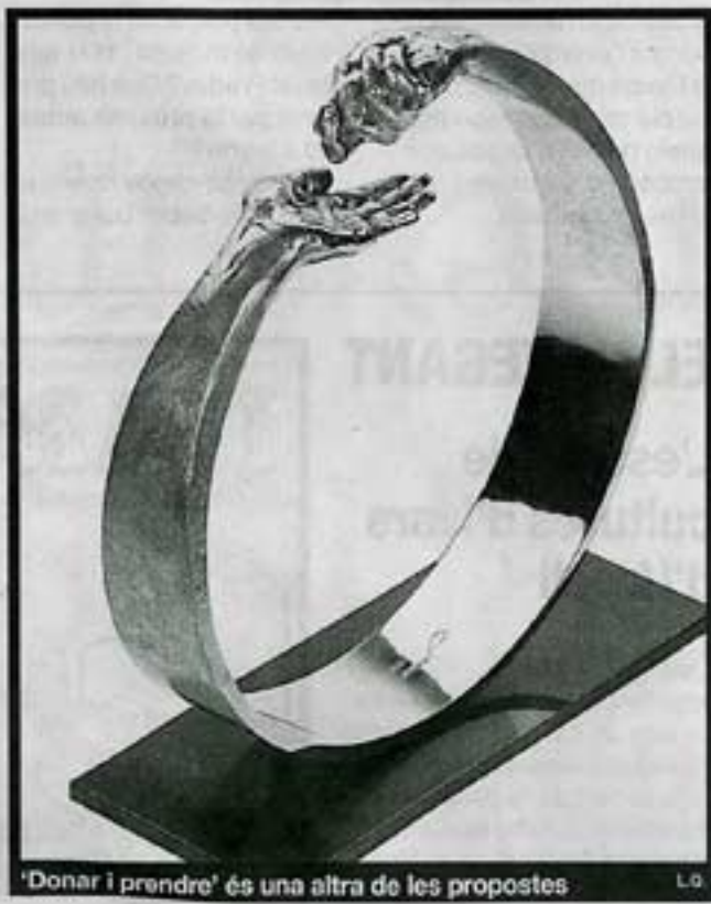
'Donar i prendre' és una altra de les propostes